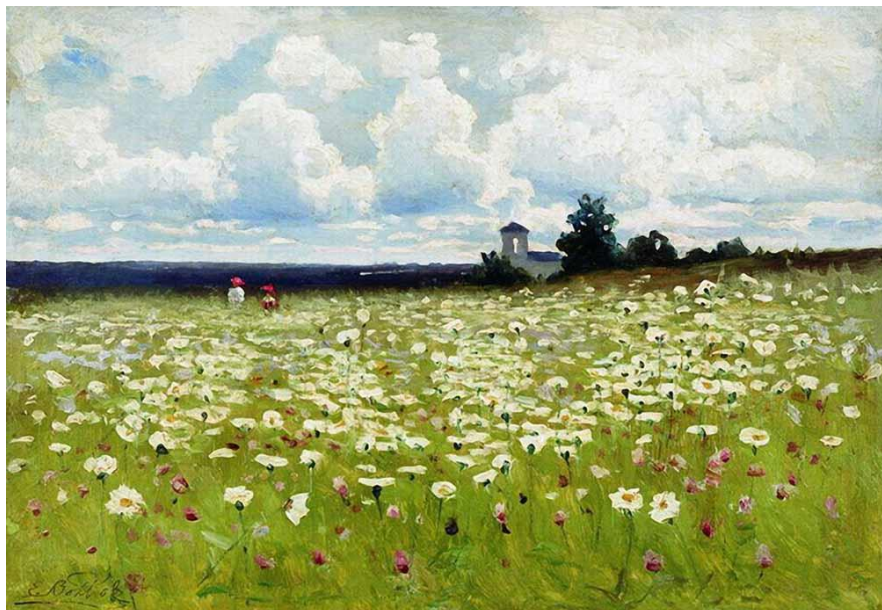
Волков Ефим Ефимович (1844-1920). Поле ромашек