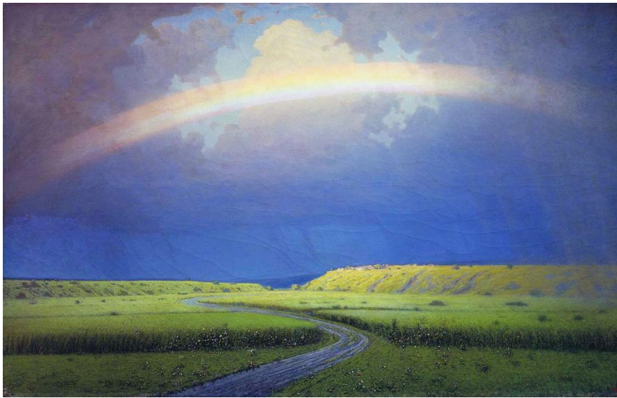
Куинджи Архип Иванович (1842-1910). Радуга. 1900-1905