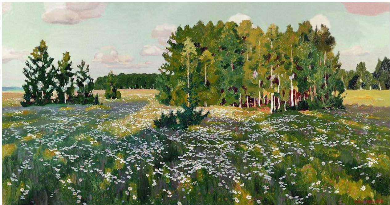
Рылов Аркадий Александрович (1870-1939). Цветистый луг. 1916