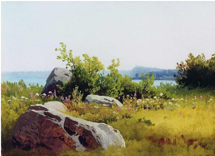
Мещёрский Арсений Иванович (1834-1902). Мостик через речку. Летние травы. 1890-е