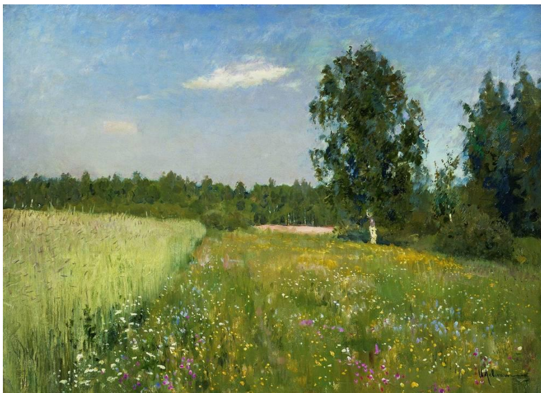
Левитан Исаак Ильич (1860-1900). Июньский день (Лето). 1890-е

Воспитатель: Правильно, ребята, многие художники очень любили лето и изображали его на своих полотнах. Посмотрите. (Показ картин)